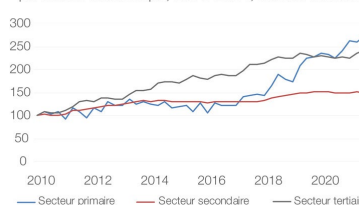
Évolution indicée (base 100=2010), nombre de frontaliers par secteur économique, 2010-2021, canton du Jura

Source OFS - Statistique des frontaliers Service de l'économie touristique et du tourisme