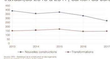
Investissements dans la construction (en mio de CHF), selon le genre de travaux, de 2013 à 2017, canton du Jura

Les détails concernant les investissements dans la construction sont disponibles sur le lien suivant .